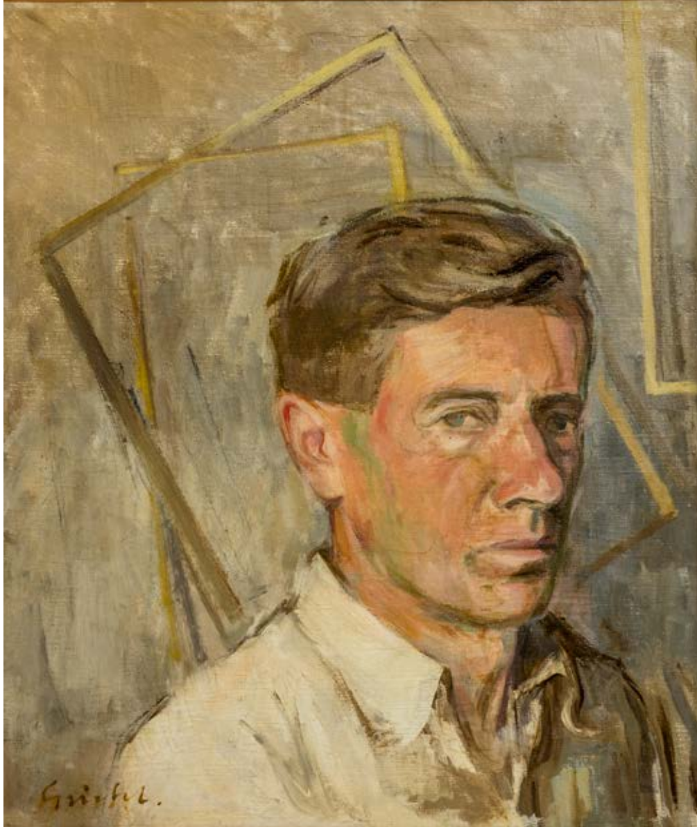
Abb. 82: Fritz Griebel: Selbstbildnisse mit leeren Bilderrahmen, 1947, Öl/Lwd., 41 x 35 cm, FG 0035

Zwei Jahre nach Kriegsende malte Griebel ein Selbstbildnis mit leeren Bilderrahmen (Abb. 82). Das als Schulterstück konzipierte Porträt konzentriert sich ganz auf Griebels leicht nach rechts geneigtes Gesicht, wodurch eine Hälfte des Gesichtes leicht verschattet ist. Die Hände, neben Pinsel und Palette, das Attribut eines Künstlers, zeigt er nicht. Er trägt auch keinen Malkittel, sondern ein wei-