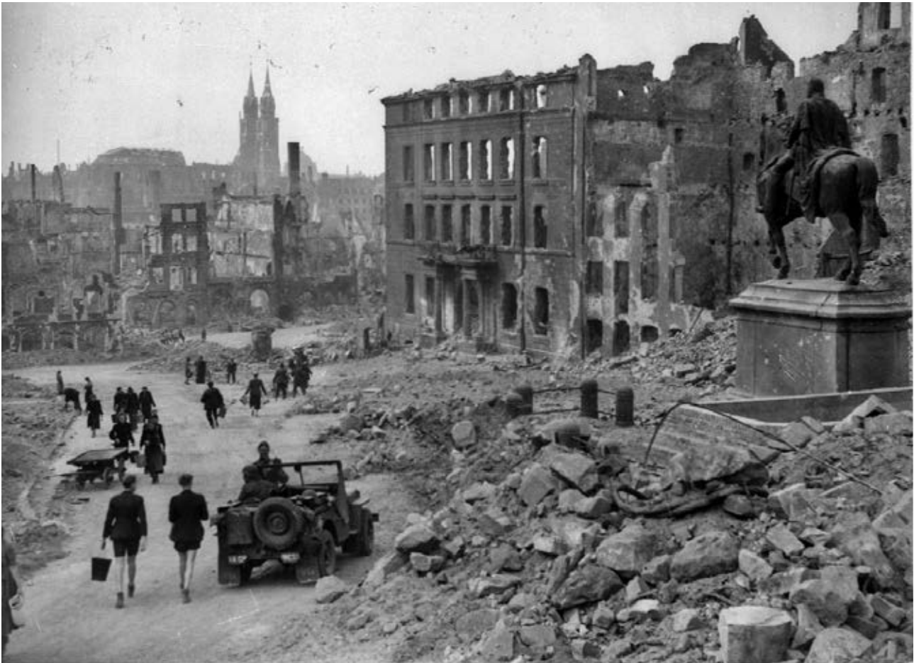
Abb. 83: Egidienplatz in Nürnberg nach der Zerstörung 1945.